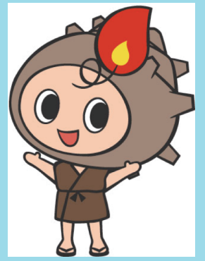
大田市マスコットキャラクター 「らとちゃん」